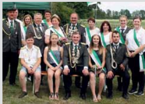
Steinbrink feiert wieder Schützenfest Seite 10