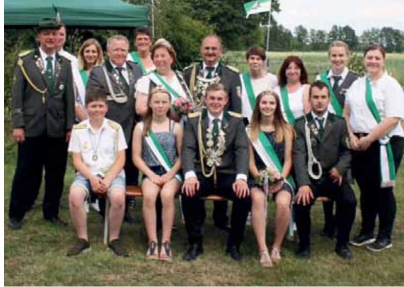
Der amtierende Hofstaat des Schützenvereins Steinbrink

Weitere Infos sowie Fotos zum Fest und das detaillierte Festprogramm unter: www.schuetzenverein-steinbrink.de