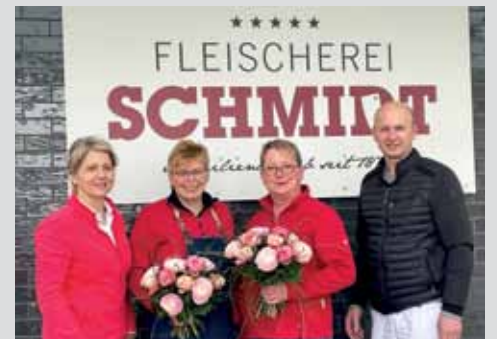
Jubiläen bei Fleischerei Schmidt Seite 12