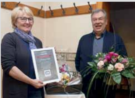
Jahreshauptversammlung vom Gewerbebund Lavelloh-Diepenau Seite 3